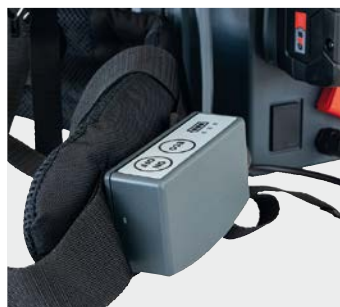
Unité de commande sur la bretelle