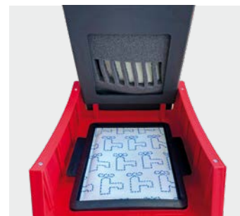
Filtre Hepa H13 avec joint (en option)