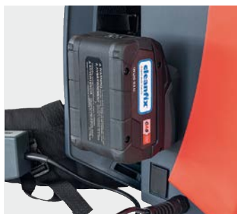
Logement de la batterie sur le côté de l'aspirateur