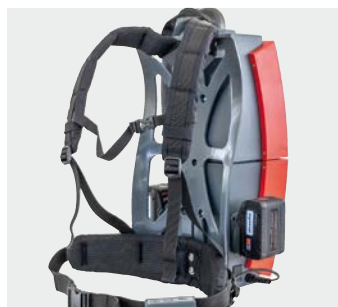
Cadre de transport ergonomique